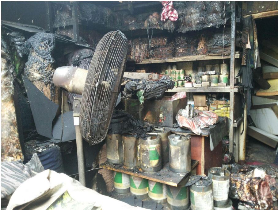
මහරගම විජේරාම කාපට් අලෙවි සැලක් ගිණි තැබීම

2017.05.23 රත්නපුර දිස්ත්‍රික්කයේ කහවත්ත නගරයේ පිහිටි මුස්ලිම් සහ දෙමළ ජාතිකයින්ට අයත් වෙළඳ සැල් දෙකකට ගිණි තබා ඇත.