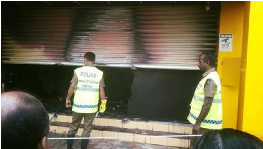
ලවර්ස් බග් ගිණි තැබීම

2017.05.21 ගාල්ල, ඇල්පිටිය නගරයේ තිබූ 'ලවර්ස් බග්' වෙළෙඳසැලක් ගිණි තබා ඇත. පොලීසිය මේ වනතෙක් කිසිදු සැකකරුවෙක් අත් අඩංගුවට ගෙන නොමැත.