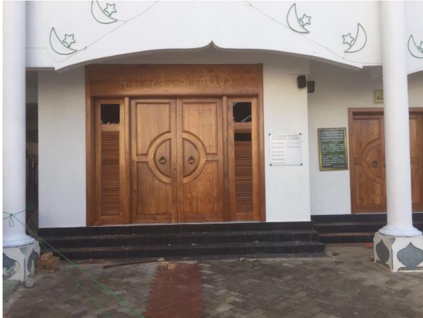
වැල්ලම්පිටිය මුස්ලිම් දේවස්ථානයට එල්ල වූ ප්‍රහාරය

2017.05.15 පානදුර පරණ බසාර් විදියේ මුස්ලිම් පල්ලියට අලුයම 3 ට පමණ පෙට්‍රල් බෝම්බ ප්‍රහාරයක් එල්ල වී ඇත. ප්‍රහාරය පිළිබඳව කිසිවෙකුත් අත්අඩංගුවට ගෙන නැත.