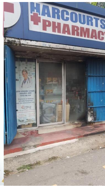
නාවින්න භාක්‍රොට්ස් පෙට්‍රල් බෝම්බ ප්‍රහාරය